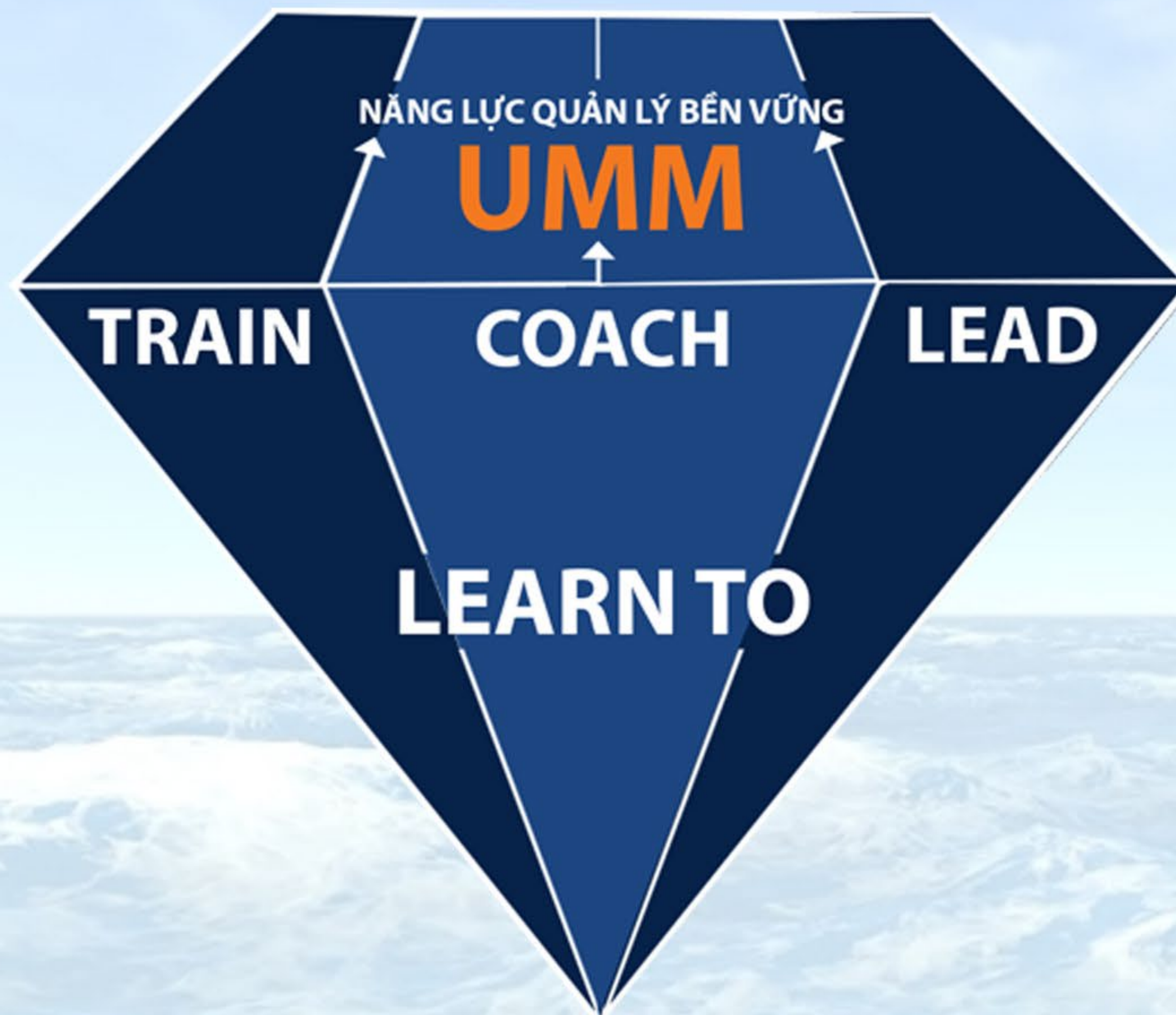
Diamond Model of Management (DMM) by VMP Academy

Khóa học thuộc bộ ba giải pháp giúp “nhà quản lý phát triển bền vững” Learn To Coach bên cạnh: Learn To Train và Learn To Lead .